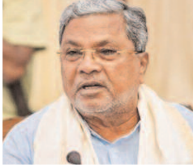
को मंगलवार को दिल्ली बुलाया गया था, जहां उन्होंने राहुल गांधी और मल्लिकार्जुन

जब सिद्धारमैया से पूछा गया कि क्या वे कांग्रेस के इस फैसले से असहमत हैं तो उन्होंने जवाब दिया, हम हाईकमान के निर्देशों के अनुसार कार्य करेंगे। यह राज्य सरकार का निर्णय नहीं है। आपको बता दें कि मुख्यमंत्री सिद्धारमैया और उपमुख्यमंत्री डीके शिवकुमार