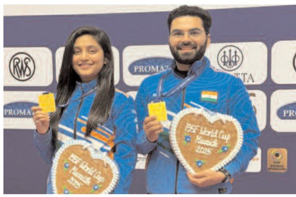
317.5 का स्कोर कर। अन्य भारतीय जोड़ी, एलावेनिल

मेडल जीता। नॉर्वे के जीनेट हेग ड्यूस्टैड और जॉन-हरमन हेग ने के सेगन मेडलेना और पीटर मैथ्यू फियोरी को 16-14 से हरा कर ब्रॉन्ज मेडल जीता। बोरसे और बाबूता क्वालिफिकेशन में 635.2 के साथ फाइनल में अपना स्थान पक्का किया बोरसे और बाबूता ने पहले 635.2 के क्वालिफिकेशन स्कोर के साथ फाइनल के लिए स्थान पक्का किया। वह दूसरे स्थान पर रहे। बाबूता ने क्वालिफिकेशन में 317.7 का स्कोर बनाया जबकि बोरसे ने