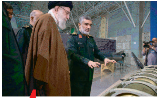
पृष्ठ 4 इरान और इजरायल के तीव्र होते युद्ध से बढ़ते खतरे

उत्तर प्रदेश और दिल्ली से एक साथ प्रकाशित