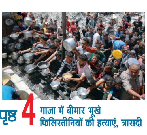
पृष्ठ 4 गाजा में बीमार भूखे फिलिस्तीनियों की हत्याएं, त्रासदी