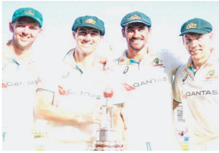
अपना शिकार बनाया। इसी के साथ स्कॉट बोलैंड टेस्ट में हैट्रिक लेने वाले 10वें ऑस्ट्रेलियाई खिलाड़ी बन गए। वह पिंक बॉल टेस्ट में हैट्रिक लेने वाले दुनिया के पहले गेंदबाज हैं। मुकाबले की बात करें, तो टॉस जीतकर पहले बल्लेबाजी के लिए

नई दिल्ली, एजेंसी। वेस्टइंडीज की टीम ऑस्ट्रेलिया के खिलाफ टेस्ट सीरीज का तीसरा मुकाबला 176 रन से गंवा बैठी। जमैका में मेजबान टीम को जीत के लिए महज 204 रन का टारगेट मिला था, जिसके जवाब में वेस्टइंडीज सिर्फ 27 रन पर ऑलआउट हो गई। इसी के साथ ऑस्ट्रेलिया ने टेस्ट सीरीज में 3-0 से क्लीन स्वीप कर लिया। यह टेस्ट इतिहास का दूसरा न्यूनतम स्कोर है। इससे पहले, मार्च 1955 में न्यूजीलैंड की टीम इंग्लैंड के खिलाफ 26 रन पर ढेर हो चुकी है। बात अगर वेस्टइंडीज की करें, तो इससे पहले यह टीम मार्च 2004 में इंग्लैंड के खिलाफ सिर्फ 47 रन पर सिमट चुकी है। वेस्टइंडीज की इस पारी में ऑस्ट्रेलियाई तेज गेंदबाज स्कॉट बोलैंड ने हैट्रिक चटकाई। उन्होंने 14वें ओवर की शुरुआती तीन गेंदों पर जस्टिन ग्रीव्स, शमर जोसेफ और जोमेल वारिकन को