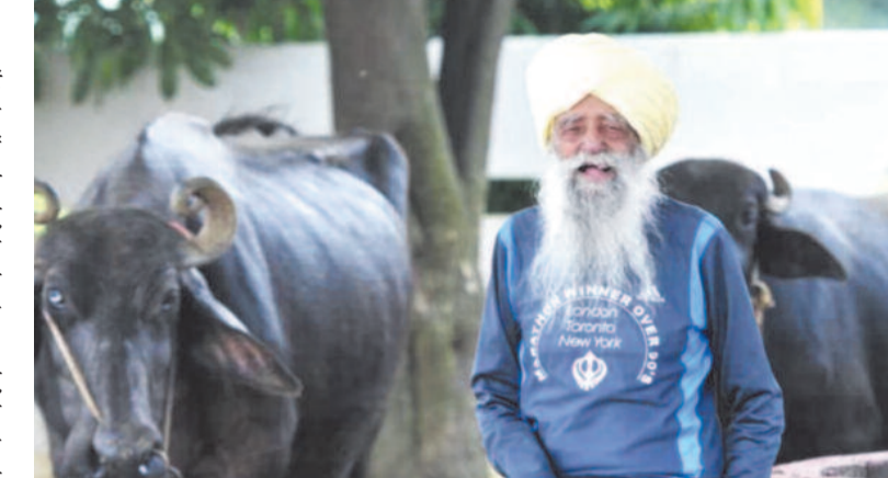
दुनिया के सबसे उम्रदराज धावक फौजा सिंह ने अंतरराष्ट्रीय मैराथन प्रतिस्पर्धा से संन्यास की घोषणा कर दी। हांगकांग में हुई मैराथन उनकी जिंदगी की

टर्बन टोर्नेडो लिखी थी। फौजा सिंह का बचपन आसान नहीं था। उनके परिवार ने सोचा कि वह अपंग हैं क्योंकि वह पांच साल की उम्र तक चलने में सक्षम नहीं थे। पतले और कमजोर पैरों के कारण वह मुश्किल से लंबी दूरी तक चल पाते थे। उन्होंने अपने परिवार के लिए खेती शुरू की। उनकी शादी ज्ञान कौर के साथ हुई और उनके तीन बेटे और तीन बेटियां हुईं। साल 1992 में वह इंग्लैंड चले गए। फौजा सिंह ने धार्मिक कार्यों के लिए 1999 में 89 साल की अवस्था में मैराथन में हिस्सा लेने का फैसला लिया था। उन्होंने लंदन, टोरंटो और न्यूयॉर्क में 26 मील की फुल मैराथन नौ बार पूरी की है। उन्होंने सबसे बेहतरीन समय टोरंटो में निकाला था। यहां उन्होंने पांच घंटे 40 मिनट में अपनी रेस खत्म की थी। 101 साल की उम्र में