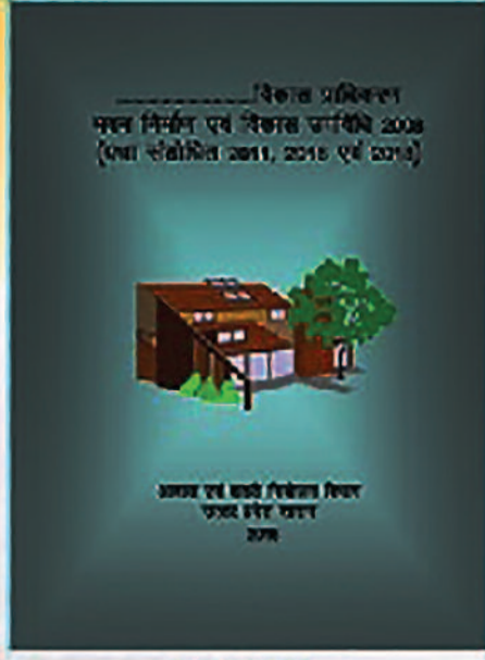
BBL 2008 (last amended in 2023)