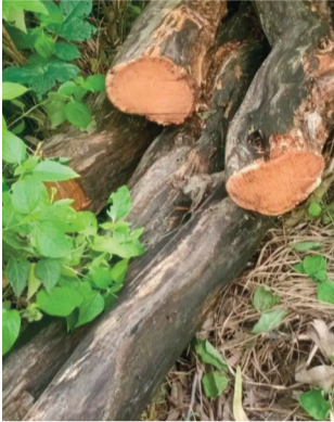
आरोपी गाड़ी छोड़कर भाग गए। जब