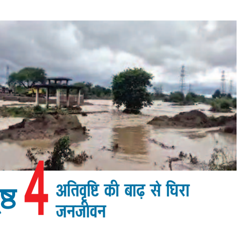
पृष्ठ 4 अतिवृष्टि की बाढ़ से घिरा जनजीवन