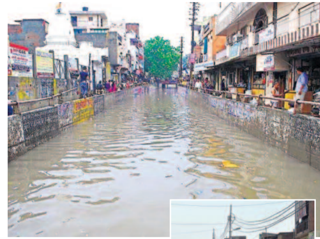
* एनसीआर टुडे, गाजियाबाद *

शहर में मंगलवार देर रात से ही राहगार भारी बारिश ने जनजीवन को पूरी तरह प्रभावित कर दिया है। सबसे ज्यादा असर गौशाला अंडरपास पर देखा गया, जहां जलभराव के चलते रास्ता बंद, पुलिस तैनात है, और पुलिस ने सुरक्षा को देखते हुए भारी संख्या में जवान तैनात कर दिए हैं।