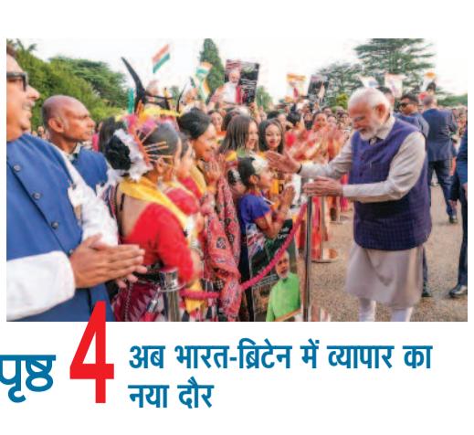
पृष्ठ 4 अब भारत-ब्रिटेन में व्यापार का नया दौर