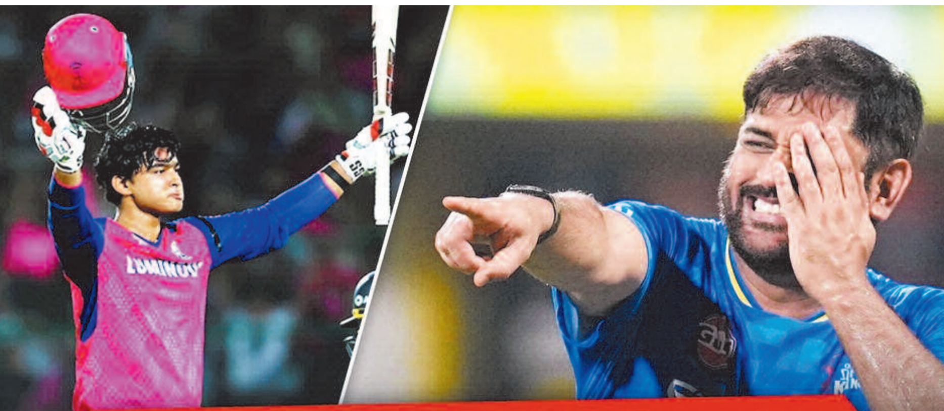
सीएसके को बचाने का आखिरी रास्ता