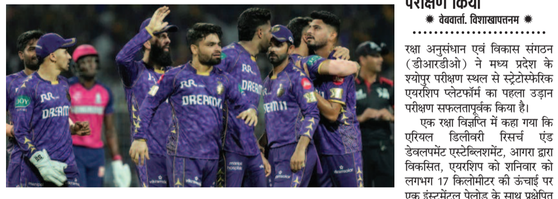
वेबवार्ता, कोलकाता *। कोलकाता नाइटराइडर्स ने राजस्थान रॉयल्स को एक रन से हरा दिया।