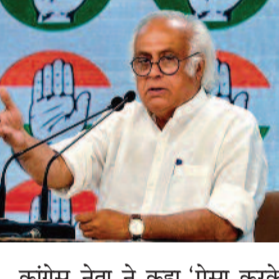
कांग्रेस नेता ने कहा, 'ऐसा करके मोदी सरकार ने उच्चतम न्यायालय से ओबीसी के लिए जाति जनगणना का आदेश न देने का स्पष्ट आग्रह किया था - 'ऐसी स्थिति में न्यायालय द्वारा जनगणना विभाग को आगामी जनगणना 2021 में ग्रामीण भारत के पिछड़े वर्ग समुदायों से संबंधित सामाजिक-आर्थिक आंकड़ों को शामिल करने का कोई भी निर्देश देना स्वीकार करेगा कि उनकी सरकार ने पिछले 11 वर्षों में जातिगत जनगणना पर अपनी नीति में आधिकारिक रूप से बदलाव किया है और क्या संसद और देशवासियों को बताएंगे कि सरकार की नीति में बदलाव की वजह क्या है और क्या अब जातिगत जनगणना करने के लिए समय सीमा तय की जाएगी।

एनसीआर टुडे, नई दिल्ली *। कांग्रेस ने रविवार को कहा कि प्रधानमंत्री नरेन्द्र मोदी हमेशा जाति जनगणना का विरोध करते रहे हैं लेकिन कांग्रेस पार्टी के दबाव में उन्हें इस मुद्दे पर अचानक और हताशा भरा यू-टर्न लेने को मजबूर होना पड़ा है। कांग्रेस संचार विभाग के प्रभारी जयराम रमेश ने आज यहां जारी एक बयान में कहा, 'प्रधानमंत्री नरेन्द्र मोदी के जातिगत जनगणना के मुद्दे पर एकदम अचानक और हताशा भरे यू-टर्न के पर्याप्त सबूत हैं।' श्री रमेश ने कुछ सबूत गिनाते हुए कहा 'पिछले साल 28 अप्रैल को एक टीवी इंटरव्यू में श्री मोदी ने जातिगत जनगणना की मांग करने वालों को 'अर्बन नक्सल' करार दिया था। मोदी सरकार ने 20 जुलाई 2021 को संसद में कहा था कि 'सरकार ने नीतिगत निर्णय लिया है कि जनगणना में अनुसूचित जातियों और अनुसूचित जनजातियों के अलावा अन्य किसी जाति की गणना नहीं की जाएगी।' देश की सर्वोच्च अदालत में 21 सितंबर 2021 को दाखिल हलफनामे में सरकार ने साफ कहा था-जनगणना 2021 के दायरे से किसी भी अन्य जाति की जांचकों को बाहर रखना केंद्र का एक सचेत नीतिगत निर्णय है।'