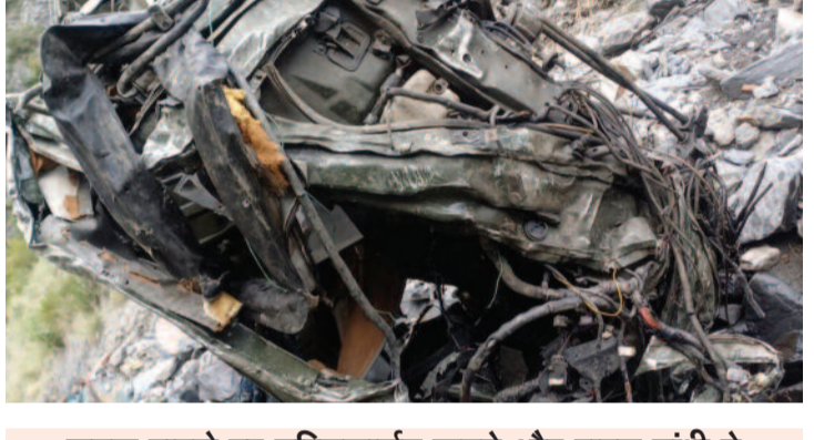
सड़क हादसे पर मल्लिकार्जुन खड़गे और राहुल गांधी ने जताया दुख

वेबवार्ता, जम्मू *। जम्मू एवं कश्मीर के रामबन जिले में जम्मू-श्रीनगर राष्ट्रीय राजमार्ग पर रविवार को एक सड़क दुर्घटना में तीन जवानों की मौत हो गई। सैन्य वाहन गहरी खाई में गिर गया। एक अधिकारी ने बताया, 'आज जम्मू-श्रीनगर राष्ट्रीय राजमार्ग पर रामबन जिले में बैटरी चरमा के पास चालक ने वाहन से नियंत्रण खो दिया और वाहन खाई में गिर गया। तीन सैनिकों की मौके पर ही मौत हो गई। बचाव अभियान तुरंत शुरू कर दिया गया। पुलिस ने घटना की प्राथमिकी दर्ज कर ली है। पिछले पखवाड़े से जम्मू-श्रीनगर राजमार्ग रामसू-रामबन खंड में भारी बारिश के कारण हुए भूस्खलन के कारण बंद रहा है। कई स्थानों पर भूस्खलन के कारण सड़क बंद गई है। राजमार्ग की मरम्मत कर यातायात के लिए बहाल कर दिया गया है, लेकिन इसके बाद भी 40 किलोमीटर से अधिक लंबा रामबन-रामसू खंड लगभग 300 किलोमीटर लंबे महत्वपूर्ण राजमार्ग की कमजोर कड़ी बना हुआ है। भूमि से घिरी घाटी के लिए सेना और सभी नागरिक आपूर्ति इसी राजमार्ग से होकर गुजरती है। इस रणनीतिक राजमार्ग के अस्थायी रूप से बंद होने से घाटी में पेट्रोलियम उत्पादों, खाद्य पदार्थों आदि सहित आवश्यक वस्तुओं की कमी हो जाती है।