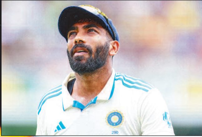
ICC टेस्ट बॉलर्स रैंकिंग

ICC टेस्ट बॉलिंग रैंकिंग बुमराह ने 904 रेटिंग पॉइंट्स हासिल किए, अश्विन के रिकॉर्ड की बराबरी की