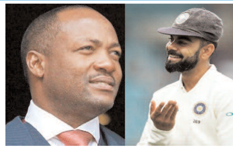
विशेषज्ञ कोहली को टेस्ट क्रिकेट में और प्रयासों के बीच, क्रिकेट जगत कोहली के योगदान देते देखा चाहते हैं। लारा की अपील और बीसीसीआई के अंतिम फैसले का इंतजार कर रहा है।

हो सकती है। बीसीसीआई के सूत्रों के अनुसार, बोर्ड कोहली के साथ गहन चर्चा कर रहा है। वे चाहते हैं कि कोहली कम से कम इस डब्ल्यूटीसी चक्र तक टेस्ट क्रिकेट खेलना जारी रखें, जिसमें इंग्लैंड के खिलाफ सीरीज के बाद ऑस्ट्रेलिया का दौरा भी शामिल है। कोहली ने टेस्ट क्रिकेट में 8,848 रन बनाए हैं, जिसमें 29 शतक और 30 अर्धशतक शामिल हैं। उनका औसत 49.15 है, जो उनकी निरंतरता और उच्च स्तर को दर्शाता है। हालांकि, कोहली ने पिछले कुछ समय से सीमित ओवरों के क्रिकेट पर अधिक ध्यान दिया है, और कुछ विशेषज्ञों का मानना है कि वह अपने करियर के इस पड़ाव पर कार्यभार को कम करना चाहते हैं। दूसरी ओर, प्रशंसक और क्रिकेट