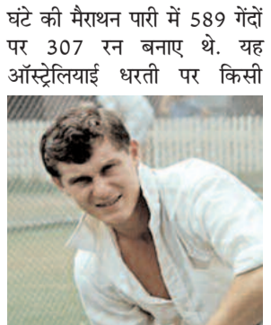
घंटे की मैराथन पारी में 589 गेंदों पर 307 रन बनाए थे। यह ऑस्ट्रेलियाई धरती पर किसी इकौलाता तिहरा शतक भी रहा। देखा जाए तो ये बॉब काउपर का तीसरा टेस्ट शतक था। उन्होंने एक साल पहले कैरेबियाई धरती पर दो शतक बनाए थे। फिर तिहरे शतक के बाद उन्होंने दो और शतक बनाए। उन्होंने आश्चर्यजनक रूप से साल 1968 में संन्यास की घोषणा की, तब वो सिर्फ 28 वर्ष के थे। काउपर ने 1964 से 1968 के बीच ऑस्ट्रेलिया के लिए 27 टेस्ट मैच खेले, जिसमें उन्होंने 46.84 के एवरेज से 2061 रन बनाए। इस दौरान उनके बल्ले से 5 शतक और 10 अर्धशतक निकले।

ऑस्ट्रेलियाई क्रिकेट में एक बेहद सम्मानित व्यक्ति थे। बॉब एक शानदार बल्लेबाज थे, जिन्हें मेलबर्न क्रिकेट ग्राउंड (स्टैब) में उनके तिहरे शतक के साथ-साथ 1960 के दशक में ऑस्ट्रेलिया और विक्टोरिया (राज्य) टीमों में उनके शानदार प्रदर्शनों के लिए हमेशा याद किया जाएगा। बाएं हाथ के बल्लेबाज बॉब काउपर को उनके बेहतरीन स्ट्रोकप्ले और संयमित बल्लेबाजी करने के लिए जाना जाता था। काउपर ने अपनी सबसे यादगार पारी फरवरी 1966 में मेलबर्न क्रिकेट ग्राउंड पर इंग्लैंड के खिलाफ खेली थी। तब उन्होंने लगभग 12