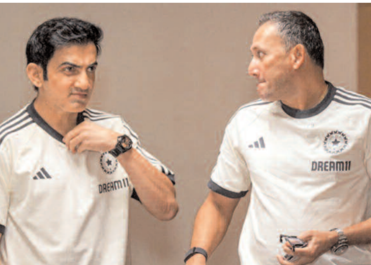
उन्होंने संन्यास का ऐलान करके सभी को चौंका दिया। इसके बाद नए कप्तान की रस में कई स्टार खिलाड़ी शामिल हो गए, जिसमें सबसे बड़ा नाम जसप्रीत

दरअसल, भारतीय दिग्गज रोहित शर्मा ने हाल ही में टेस्ट फॉर्मेट में संन्यास लिया है, जो टेस्ट टीम के कप्तान भी थे। ऐसे में इस दौरे पर भारतीय टीम एक नए कप्तान के साथ जाएगी। इस कप्तान का नाम तय हो गया है और बीसीसीआई जल्द ही इसका ऐलान भी करेगी। रोहित शर्मा के लिए ऑस्ट्रेलिया दौरा काफी खराब रहा था और टीम इंडिया को हार का सामना भी करना पड़ा था। उसके बाद से ही माना जा रहा था कि रोहित को अब टेस्ट में जाह नहीं मिलेगी। इन सब खबरों के बीच