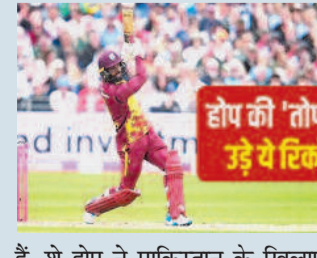
होप ने 'टोप' से उड़े ये रिकॉर्ड

बीसीसीआई पड़ोसी देश को क्रिकेट टीम के रूप में अपनी साख बेहतर बनाने में मदद कर रहा है। बीसीसीआई ने एक्स पर लिखा, आईसीसी पुरुष टी-20 विश्व कप क्वालिफायर की तैयारी के तहत नेपाल की राष्ट्रीय टीम ने दो सप्ताह के विशेष शिविर में बीसीसीआई के उत्कृष्टता केंद्र में अभ्यास किया। टीम ने सुविधाओं का पूरा उपयोग किया और आगामी चुनौतियों के लिए खुद को तैयार करने के लिए कौशल, फिटनेस और खेल की विभिन्न स्थितियों पर काम किया।