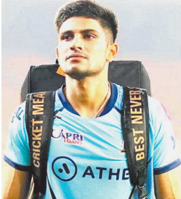
शुभमन गिल से हार गए बाबर आजम

नई दिल्ली, एजेंसी। वीनस विलियम्स जल्द ही 'बाबी डॉल' के रूप में नजर आएंगी। इस गुड़िया निर्माता कंपनी ने प्रेरणादायी महिलाओं की अपनी सीरीज में वीनस को लेकर 'बाबी डॉल' बनाई है जिसे शुक्रवार को जारी किया जाएगा। दिग्गज टेनिस खिलाड़ी वीनस विलियम्स जल्द ही 'बाबी डॉल' के रूप में नजर आएंगी। इस गुड़िया निर्माता कंपनी ने प्रेरणादायी महिलाओं की अपनी सीरीज में वीनस को लेकर 'बाबी डॉल' बनाई है जिसे शुक्रवार को जारी किया जाएगा। इस गुड़िया को उसी तरह की पोशाक पहनाई गई है जो वीनस ने 2007 में विंबलडन चैंपियन बनने के दौरान पहनी थी। यह वही वर्ष था जब पहली बार किसी ग्रैंड स्लैम टूर्नामेंट में महिलाओं को पुरुषों के बराबर पुरस्कार राशि मिली थी। इस गुड़िया की खुदरा कीमत 38 डॉलर बताई गई है, जिसमें वीनस पूरी तरह सफेद पोशाक में होंगी। उनके गले में हरे रंग का रत्न का हार, कलाई का बैंड हाथों में रैकेट और टेनिस बॉल होगी।