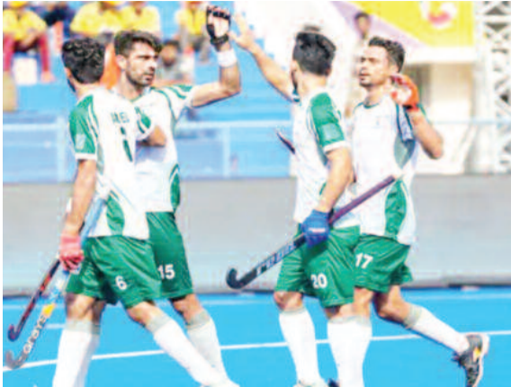
बचा है। हम शांति कायम होने का इंतजार कर रहे हैं। सरकार के जो भी निर्देश होंगे, हम उनका पालन करेंगे। भारत और पाकिस्तान के बीच 181 हॉकी मैच खेले गए। 82 में

टूर्नामेंट शुरू होने में अब भी करीब 3 महीने का समय