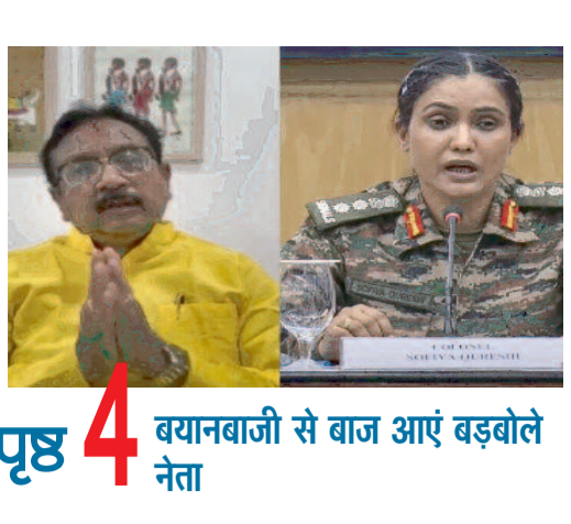
पृष्ठ 4 बयानबाजी से बाज आए बड़बोले नेता