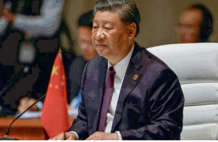
चीन के राष्ट्रपति सी चिन पिंग