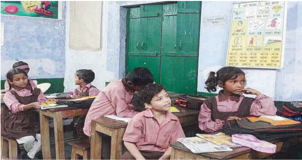
होंगे वहीं स्कूलों में शिक्षक-छत्र अनुपात भी सुधरेगा।

ऐसे में विभाग यह प्रयास करेगा कि सामान्य तबादलों से इन शिक्षकविहीन व एकल शिक्षक वाले विद्यालयों में ज्यादा शिक्षक वाले विद्यालयों का संतुलन बने। यही वजह है कि आठ साल बाद हो रहे जिले के अंदर व एक साल बाद हो रहे एक से दूसरे जिले में सामान्य तबादलों का मुख्य आधार यू-डायस पोर्टल पर उपलब्ध छत्र संख्या के आधार पर आरटीई के मानकों को बनाया गया है। बेसिक शिक्षा विभाग कि इस कवायद से जहां उसकी दिक्कतें कम