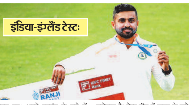
इंडिया-इंग्लैंड टेस्ट: खराब गए। अपने प्रदर्शन के बारे में उन्होंने कहा, मैं काफी रन बनाकर आईपीएल में आया था। आत्मविश्वास की कमी नहीं थी। पारी में बहुत जल्दी बड़े शॉट खेल रहा था जिस पर कोच ने अपना समय लेकर फिर आक्रामक खेलने की सलाह दी।

करुण ने पंजाब के खिलाफ मैच के बाद कहा, शानदार लग रहा है और हम इस जीत के हकदार थे। हम इस सत्र में अपना सर्वश्रेष्ठ प्रदर्शन नहीं कर सके, लेकिन इस मैच में हमने दिखा दिया कि हमारी टीम अच्छी थी लेकिन कुछ मैच