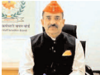
आलोक राज बीकानेर कलेक्ट्रेट परिसर में 19 से 21 सितंबर तक होने वाली ग्रेड 4 परीक्षा की तैयारियों की बैठक में शामिल होने पहुंचे थे। इस दौरान उन्होंने कहा कि सबसे पहले 5 हजार, फिर 10 हजार अभ्यर्थियों के एग्जाम टैबलेट्स पर लिए जाएंगे। धीरे-धीरे इसकी संख्या को बढ़ाया जाएगा।

जयपुर, एजेंसी। राजस्थान कर्मचारी चयन बोर्ड (आरएसएमएसएसबी) अब भर्ती परीक्षाओं में बड़ा बदलाव करने जा रहा है। बोर्ड अध्यक्ष आलोक राज ने कहा है कि राज्य में जल्द ही टैबलेट्स पर एग्जाम होंगे। इसके लिए आईआईटी कानपुर और आईआईटी मद्रास के साथ मिलकर परीक्षण चल रहा है। उन्होंने बताया कि शुरुआती नतीजे पॉजिटिव हैं और आने वाले समय में इस मॉडल को लागू किया जाएगा।