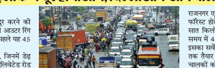
जाम की समस्या बनी रहती है। इसे दूर करने के लिए जीडीए यहां के जोनल प्लान की आउटर रिंग रोड व अन्य मार्गों को विकसित करने में जुटा है। इसमें मुख्य रूप से

गाजियाबाद, एजेंसी। राजनगर एक्सप्रेसटेशन से जाम की समस्या दूर करने की तैयारी की जा रही है। यहां के जोनल प्लान की आउटर रिंग रोड को अब 60 मीटर चौड़ी बनाया जाएगा। पहले यह 45 मीटर चौड़ी प्रस्तावित थी। राजनगर एक्सप्रेसटेशन में 65 सोसाइटी हैं, जिनमें डेढ़ लाख से अधिक आबादी रहती है। साथ ही एलिवेटेड रोड के जरिये दिल्ली जाने वाले ज्यादातर वाहन राजनगर एक्सप्रेसटेशन से ही होकर गुजरते हैं। इसमें मुख्य रूप से मुरादनगर, मोदीनगर और मेरठ से आने वाले वाहन शामिल हैं। इस कारण राजनगर एक्सप्रेसटेशन में सुबह शाम