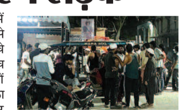
जाम की समस्या बनी रहती है। इसे दूर करने के लिए जीडीए यहां के जोनल प्लान की आउटर रिंग रोड व अन्य मार्गों को विकसित करने में जुटा है। इसमें मुख्य रूप से