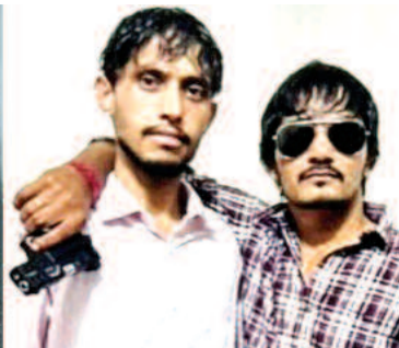
देखा जा सकता है। उसने कहा कि बाइक पर पीछे बैठा हुआ युवक का चेहरा क्लियर है, वह भी उसका भाई नहीं है।