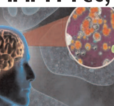
केरल में इस दुर्लभ बीमारी के मामले पुष्ट हो चुके हैं। इनमें 61 मरीजों की मौत हो चुकी है। यह एक दुर्लभ बीमारी है जो आमतौर पर अमीबा युक्त तालाब में नहाने वाले 26 लाख लोगों में से केवल एक को ही संक्रमित करती है। केरल के स्वास्थ्य अधिकारियों ने बताया कि जुलाई से 'मस्तिष्क ज्वर' के

तिरुवनंतपुरम, एजेंसी। केरल में दुर्लभ और घातक मस्तिष्क संक्रमण 'अमीबिक मेनिंजोएन्सेफलाइटिस' से मौतों का सिलसिला लगातार जारी है। स्वास्थ्य अधिकारियों के मुताबिक, राज्य में अब तक इस बीमारी की वजह से 19 लोगों की मौत हो चुकी है। इनमें से कई मौतें पिछले कुछ हफ्तों के भीतर हुई हैं, जिससे लोगों की चिंता बढ़ गई है। स्वास्थ्य अधिकारी प्राइमरी अमीबिक मेनिंजोएन्सेफलाइटिस के मामलों में वृद्धि के बाद सतर्क हो गए हैं। यह एक मस्तिष्क संक्रमण है जिसकी मृत्यु दर बहुत अधिक है। यह संक्रमण नैस्लेरिया फाइजों के कारण होता है, जिसे आमतौर पर दिमाग खाने वाला अमीबा कहा जाता है। इस वर्ष,