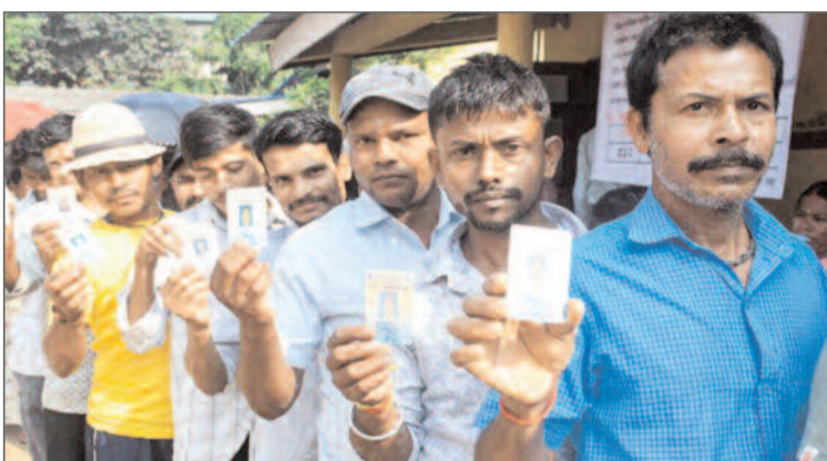
पहले जन्म लेने वालों को 12 में से एक दस्तावेज पेश करना होगा, जहां आधार कार्ड को सिर्फ आईडी प्रूफ माना जाएगा। 1987 से 2004 के बीच पैदा हुए लोगों को दो दस्तावेज पेश करने होंगे। इनमें एक खुद की जन्मतिथि और एक माता-पिता की होगी। अगर पैरेंट में से कोई एक विदेशी नागरिक है, तो पासपोर्ट और वीजा डिटेल