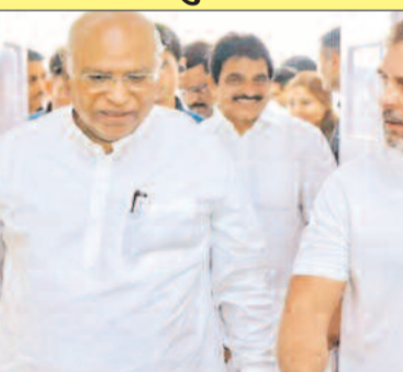
बैठक में वर्तमान राजनीतिक परिदृश्य पर चर्चा की जाएगी। इसमें वोट चोरी और मतदाता सूची के गहन पुनरीक्षण यानी एसआईआर समेत राज्य के अन्य मुद्दों पर फोकस होगा। राहुल गांधी की यात्रा भी एसआईआर पर केंद्रित थी। कांग्रेस कार्यसमिति की बैठक को राज्य में अपने कार्यकर्ताओं में उत्साह भरने के रूप में देखा जा रहा है। इसके

यात्रा कर रहे हैं। इससे पहले वह राहुल के साथ भी वोट अधिकार यात्रा में शामिल थे। दूसरी तरफ, आगामी बिहार विधानसभा चुनाव के मद्देनजर कांग्रेस ने अपने संभावित उम्मीदवारों के नामों पर मंथन शुरू कर दिया है। इसी सिलसिले में गुरुवार (18 सितंबर) को पटना में कांग्रेस की प्रदेश इलेक्शन कमिटी की पहली बैठक बुलाई गई है। यह बैठक पार्टी की आगामी रणनीति, संभावित उम्मीदवारों के चयन और स्क्रीनिंग प्रक्रिया को अंतिम रूप देने के लिहाज से बेहद अहम मानी जा रही है। बैठक में कमिटी के 39 सदस्य साथ ही सभी सांसद, विधायक, विधान परिषद, कांग्रेस के बिहार सचिव, कार्यसमिति के सदस्य और पार्टी के फ्रंटल संघटनों के प्रमुख भी शामिल होंगे।