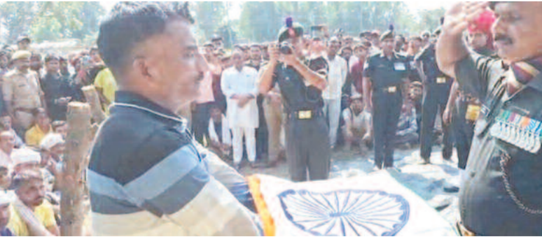
छुट्टी मिली थी। उसी दौरान उन्होंने सीनियर द्वारा परेशान किए जाने की जानकारी दी थी, लेकिन किसी का नाम नहीं बताया था।