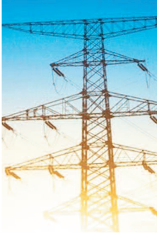
विरोध करने का एलान किया है। क्योंकि विद्युत अधिनियम 2003 की धारा 47(5) में उपभोक्ताओं को दिए गए प्रीपेड

स्मार्ट प्रीपेड मीटर थोपना असंवैधानिक, हर स्तर पर विरोध का एलान : प्रदेश में स्मार्ट प्रीपेड मीटर को लेकर विरोध के सुर तेज होते जा रहे हैं। राज्य विद्युत उपभोक्ता परिषद सहित अन्य संगठनों ने इसका हर स्तर पर