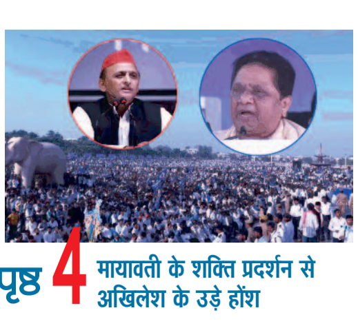
पृष्ठ 4 मायावती के शक्ति प्रदर्शन से अखिलेश के उड़े होंश