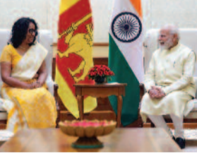
प्रधानमंत्री नरेंद्र मोदी से मुलाकात कर द्विपक्षीय संबंधों के विभिन्न पहलुओं पर विचार विमर्श किया।

श्रीलंका की प्रधानमंत्री डॉ. हरिनी अमरसूर्या ने शुक्रवार को यहां