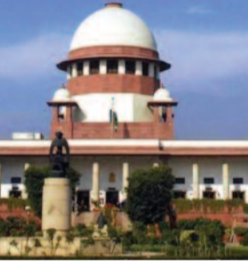
जल्द कठोर कार्रवाई करनी चाहिए।

कोर्ट ने कहा कि यह मामला कोई अकेला मामला नहीं है। मीडिया में कई बार ऐसी खबरें छपी हैं और देश के विभिन्न हिस्सों से ऐसी खबरें लगातार आ रही हैं। इसलिए इस पर जल्द से