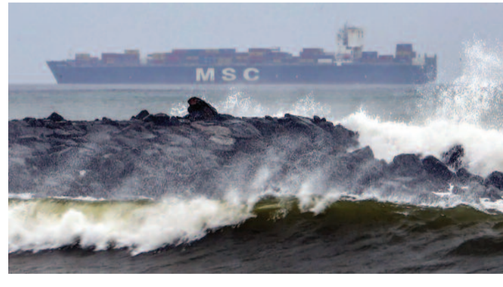
* वेबवार्ता, कोलकाता/हैदराबाद/अमरावती *

भीषण चक्रवाती तूफान 'मोंथा' के कारण पश्चिम बंगाल, ओडिशा, आंध्र प्रदेश और तेलंगाना सहित कई राज्यों में भारी नुकसान हुआ है। तेलंगाना में भारी बारिश से जुड़ी घटनाओं में कम से कम छह लोगों की मौत हो गई है। आंध्र प्रदेश के तट से टकराने के बाद हालांकि 'मोंथा' कमजोर पड़ गया।