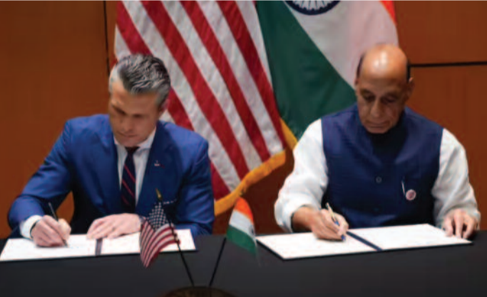
रक्षा मंत्रालय ने एक वक्तव्य जारी कर कहा कि इस समझौते से दोनों देशों के बीच रक्षा भागदारी और मजबूत बनेगी। रक्षा मंत्री राजनाथ सिंह ने कहा है कि यह समझौता भारत-अमेरिका रक्षा संबंधों के संपूर्ण आयाम को नीतिगत दिशा प्रदान करेगा और साझेदारी के एक नए दशक का सूत्रपात करेगा। उन्होंने कहा कि रक्षा क्षेत्र भारत-अमेरिका संबंधों का प्रमुख शतंभ बना रहेगा।

भारत और अमेरिका ने रक्षा उद्योग, सेनाओं और रक्षा प्रौद्योगिकी के क्षेत्र में सहयोग बढ़ाने के लिए दस वर्ष के महत्वाकांक्षी रक्षा समझौते (रक्षा प्रेमवर्क समझौते) पर हस्ताक्षर किये हैं। रक्षा मंत्री राजनाथ सिंह और अमेरिका के युद्ध मंत्री पीट हेगसेथ ने शुक्रवार को कुआलालंपुर में आसियान देशों के रक्षा मंत्रियों की 12 वीं बैठक से इतर हुई बैठक में वार्ता के बाद इस समझौते पर हस्ताक्षर किये। इस समझौते के अंतर्गत अमेरिका भारत के साथ उन्नत रक्षा प्रौद्योगिकी साझा करेगा।