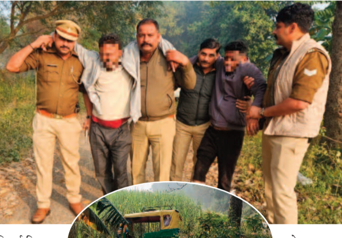
खोखा कारतूस सहित, बराज मैक्सिमा सप्ली टैम्पो नंबर UP20CT0963, दोनों आरोपी लूट की नीयत से टैम्पो चलाते थे। आरोपी ने पूछताछ में बताया कि वे जीविकोपार्जन के नाम पर टैम्पो चलाते थे, लेकिन सवारी के रूप में भोले-भाले लोगों को बैठाकर सुनसान जगहों पर ले जाकर लूटपाट करते थे। महिला से लूटे गए गहने और मोबाइल को वे बेचने के लिए ग्राहकों की तलाश में थे, तभी पुलिस ने उन्हें पकड़ लिया। इस घटनाक्रम में थाना हलदौर पुलिस की सराहना भूमिका रहती है जिसमें थाना प्रभारी सर्विलॉस/स्वाट सेल टीम, जनपद बिजनौर, पुलिस अधीक्षक ने हलदौर पुलिस टीम की तत्परता, सक्रियता और बहादुरी की सराहना की है।

हलदौर पुलिस ने महिला से लूटपाट करने वाले दो शांतिर बदमाशों को मुठभेड़ के बाद गिरफ्तार कर बड़ी सफलता हासिल की है। दोनों लुटेरों को पुलिस की जवाबी कार्रवाई में पैर में गोली लगी। बदमाशों के पास से महिला के गहने, मोबाइल, अवैध तमंचे और घटना में प्रयुक्त टैम्पो बरामद किया गया। लुटेरों ने बस स्टैंड से बेटाया, सुनसान नहर किनारे ले जाकर लूटे गहने।