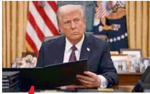
पृष्ठ 4 परमाणु संकट की ओर धकेलने की इजाजत नहीं दे सकते

उत्तर प्रदेश और दिल्ली से एक साथ प्रकाशित वर्ष : 17 अंक : 021 गाजियाबाद, शुक्रवार 07 नवंबर 2025 मूल्य : ₹ 2 पेज : 06 विक्रमी संवत् 2081 युगाब्द 5126 शाक 1946