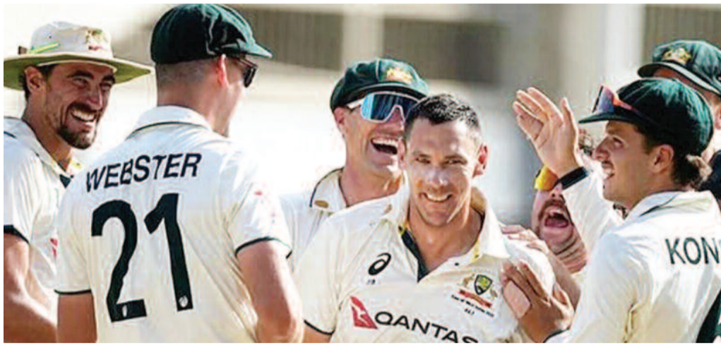
स्कॉट बोलेड को मौका मिलना तय है। इसके दो अन्य तेज गेंदबाज हेजलवुड और मिचेल स्टार्क होंगे।

दिग्गज तेज गेंदबाज जोश हेजलवुड पहले टेस्ट में खेलने के लिए फिट हो गए हैं, लेकिन सीन एबट चोटिल होकर बाहर हो गए हैं। एबट का चोटिल होना इसलिए भी ऑस्ट्रेलिया के लिए झटका है क्योंकि कप्तान पैट कमिंस चोटिल होने के कारण पहले से ही बाहर है। शेफील्ड शील्ड टूर्नामेंट में विकटोरिया के खिलाफ न्यू साउथ वेल्स के लिए खेलते हुए हेजलवुड और एबट को हेमरिंस में दिक्कत हुई। दोनों को स्कैन के लिए भेजा गया। ऑस्ट्रेलिया को हेजलवुड के फिट होने की राहत भरी खबर मिली, लेकिन एबट के बाहर होने को लेकर बुरी खबर आ गई। हालांकि, एबट का पर्थ में खेलना मुश्किल था। कमिंस की जगह ऑस्ट्रेलिया की प्लेडिंग 11 में