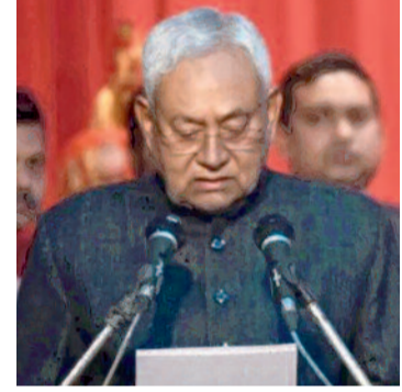
(हम) और राष्ट्रीय लोक मोर्चा (आरएलएम) को भी सरकार में प्रतिनिधित्व दिया जाएगा। सूत्रों के मुताबिक, भाजपा नेतृत्व ने राष्ट्रीय जनतांत्रिक गठबंधन (एनडीए) के सहयोगियों चिराग पासवान, जितनराम मांझी व उपेंद्र कुशवाहा से भी चर्चा की है। प्रधानमंत्री नरेंद्र मोदी के आवास पर रविवार को आला नेताओं की बैठक में नई सरकार की रूपरेखा को अंतिम रूप दिया गया। लोजपा (आर) के

* वेवार्ता. बिहार * विधासभा चुनाव परिणाम के बाद बिहार में सरकार गठन का फॉर्मूला तय हो गया है। भाजपा-जदयू के बीच छह विधायकों पर एक मंत्री का फॉर्मूला लागू होगा। नीतीश कुमार 10वीं बार मुख्यमंत्री पद की शपथ लेंगे। भाजपा, जदयू, लोजपा (आर), हम और आरएलएम को मंत्री पद मिलेंगे। सोमवार को नीतीश इशतीफा देंगे और 20 नवंबर तक नई सरकार शपथ ले सकती है। बिहार में सरकार गठन के फॉर्मूले पर भाजपा और जदयू में सहमति बन गई है। नीतीश कुमार 10वीं बार मुख्यमंत्री पद की शपथ लेंगे। केंद्रीय गृह मंत्री अमित शाह के साथ शनिवार दे रात जदयू के कार्यकारी राष्ट्रीय अध्यक्ष संजय झा, केंद्रीय मंत्री राजीव रंजन उर्फ ललन सिंह, भाजपा अध्यक्ष जेपी नड्डा की बैठक में छह विधायक पर एक मंत्री के फॉर्मूले पर आगे बढ़ने का फैसला हुआ। लोजपा (आर) के साथ छह विधायक से कम संख्या वाली हिंदुस्तानी अवांम मोर्चा