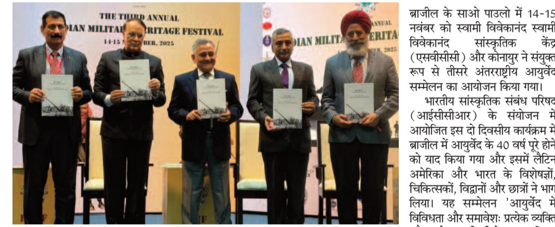
एनसीआर टुडे, नई दिल्ली * | भारतीय सैनिकों को सर्वोत्तम प्रथाओं को शामिल किया जाएगा।