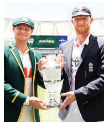
का ऐलान कर दिया है।

नई दिल्ली, एजेंसी। ऑस्ट्रेलिया और इंग्लैंड के बीच 5 टेस्ट मैचों की रोमांचक एशेज सीरीज का आगाज शुक्रवार से पर्थ में हो रहा है। फैंस सीरीज को लेकर बेहद रोमांचित हैं। क्रिकेट ऑस्ट्रेलिया के मुताबिक सभी पांच टेस्ट मैचों के पहले दिन के टिकट बिक गए हैं। क्रिकेट ऑस्ट्रेलिया के मुताबिक पर्थ टेस्ट के लिए, दूसरे और तीसरे दिन के टिकट तेजी से बिक रहे हैं, जबकि चौथे दिन के लिए अच्छी अवलेबिलिटी है। दूसरा टेस्ट 4 दिसंबर से ब्रिस्बेन में खेला जाएगा। ब्रिस्बेन टेस्ट के पहले तीन दिन के टिकट बिक चुके हैं। चौथे दिन के टिकट तेजी से बिक रहे हैं। तीसरा टेस्ट 17 दिसंबर से एडिलेड में खेला जाएगा। तीसरे टेस्ट के पहले तीन दिन के टिकट भी बिक चुके हैं। चौथा टेस्ट मेलबर्न में 26 दिसंबर से खेला जाएगा। मेलबर्न टेस्ट के पहले दो दिनों के टिकट बिक चुके हैं। तीसरे दिन के लिए बहुत कम टिकट बचे हुए हैं। चौथे दिन के लिए भी टिकट बिक रहे हैं। पांचवां टेस्ट 4 जनवरी 2026 से सिडनी में खेला जाएगा। सिडनी टेस्ट के पहले चार दिनों के टिकट बिक चुके हैं। सभी पांच टेस्ट के लिए, पांचवें दिन के टिकट मैच की स्थिति के आधार पर दिए जाएंगे। पर्थ में होने वाले पहले टेस्ट के लिए ऑस्ट्रेलिया ने अपनी प्लेइंग इलेवन