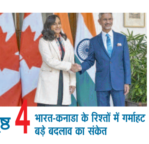
पृष्ठ 4 भारत-कनाडा के रिश्तों में गर्माहट बढ़े बदलाव का संकेत